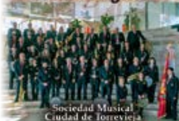
Sociedad Musical Ciudad de Torrevieja