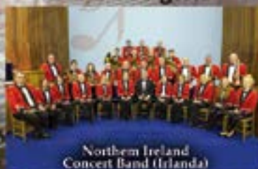
Northern Ireland Concert Band (Irlanda)