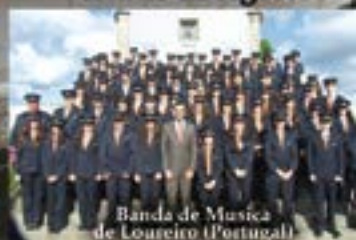
Banda de Música de Loureiro (Portugal)