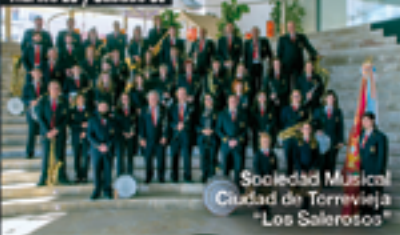
Sociedad Musical Ciudad de Torrevieja "Los Salerosos"

Banda de Música Miraflores Gibralfajre (Málaga)