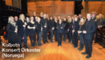
Kolbotn Konsert Orkester (Noruega)

Filarmonica Beethoven del Campo de Criptana (Ciudad Real)